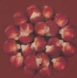
Millo colorado El Ortigal, Tenerife