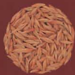
Cebada El Isote, Lanzarote