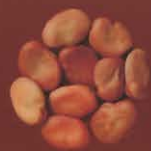
Habas La Laguna, Tenerife