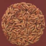
Centeno Garafía, La Palma