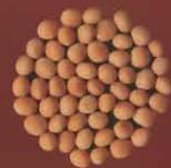
Arvejas lisas Mala, Lanzarote