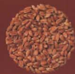
Trigo de barbilla El Ortigal, Tenerife