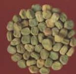
Arvejas chochas o de manteca San Bartolomé, Lanzarote