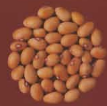
Judías de manteca o mantequeras La Laguna, Tenerife