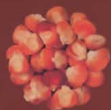
Millo de la tierra Tinajo, Lanzarote