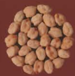
Garbanzas Tetir, Fuerteventura