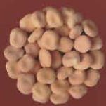
Chochos San Andrés, El Hierro