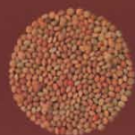
Lentejas La Oliva, Fuerteventura