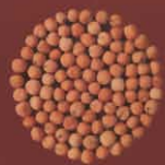
Arvejas menudas o de paloma Tinajo, Lanzarote