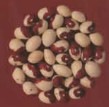
Judías huevo de hornero El Batán, Tenerife