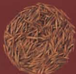
Avena negra La Laguna, Tenerife