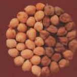
Garbanzos y Garbanzos colorados Tetir, Fuerteventura Las Triclas, La Palma