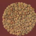
Lentejas Máquez, Lanzarote