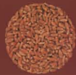
Trigo morisco San Miguel, Tenerife