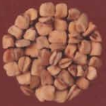
Chicharos Tetir, Fuerteventura