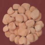
Chicharones Teguise, Lanzarote