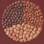
Archita, Lentejones y Chicharos de burro El Pinar, El Hierro