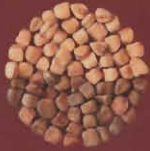
Chicharos castellanos Teno Alto, Tenerife