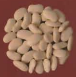
Judías blancas Teguise, Lanzarote