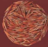
Avena amarilla Cueva de Sosa, Gran Canaria